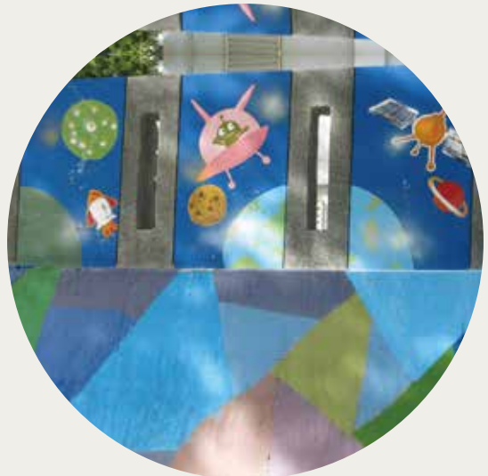
04 | 第四區隊 - 東里國小 牆面彩繪

良好、對偏鄉藝術教育有興趣及熱誠，肯吃苦耐勞且勇於接受挑戰之大專院校在學學生（含研究所以上）。