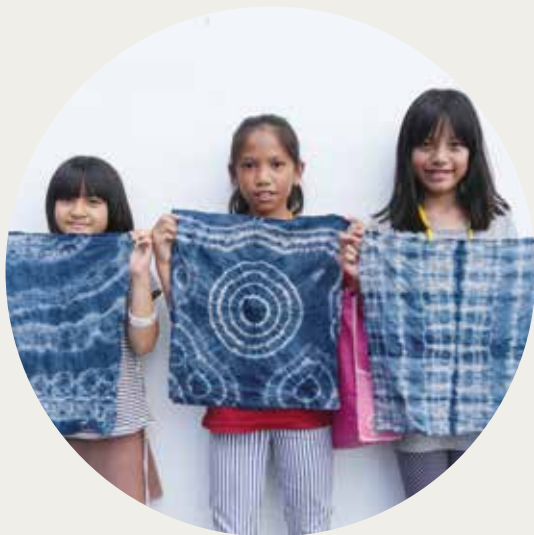
03 | 第三區隊 - 民權國小 藍染課程