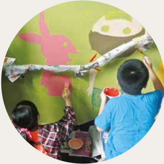
01 | 第一區隊 - 金鼎國小 牆面彩繪