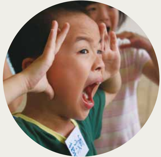
02 | 第二區隊 - 草嶺地質生態國小 肢體開發