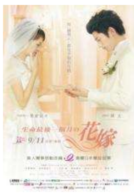
生命中最後一個月的花嫁